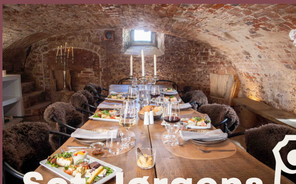
Sct. Jørgens Gaard